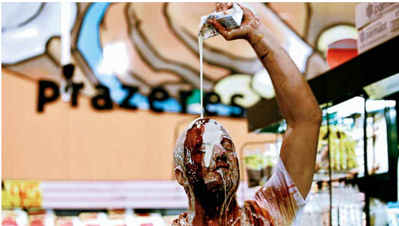
Eduardo Srur SUPERMARKET, 2012 video 07'49" ©Fernando Huck